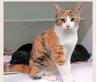
Pia, weiblich, Tricolor, etwa ein Jahr alt

Der süsse Enzo hat durch einen Unfall leider nur noch drei Beine. Der lustige und liebesbedürftige Kater sucht ein neues Zuhause in einem abgelegenen und sicheren Quartier.