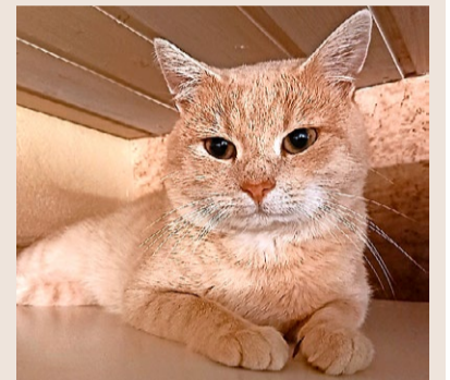
Enzo, männlich, kastriert, beige getigert, etwa zwei Jahre alt

Der weiss-graue Kater ist an der Zürcherstrasse in St.Gallen zugelassen. Migg ist ein sehr aufgestellter und lieber Jungkater.